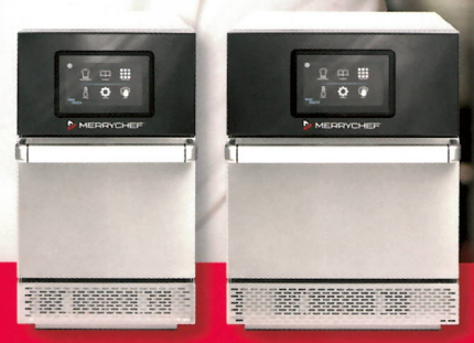
Die neuen Merrychef connex® Highspeedöfen