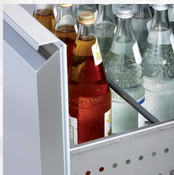
Schubladen Korpus CNS (1.4301) mit Übervollauszug Drawer housings made of stainless steel (1.4301 / AISI 304), fully extendable