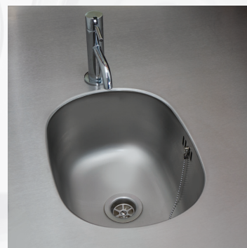
Ausgussbecken bündig integriert Integrated basin