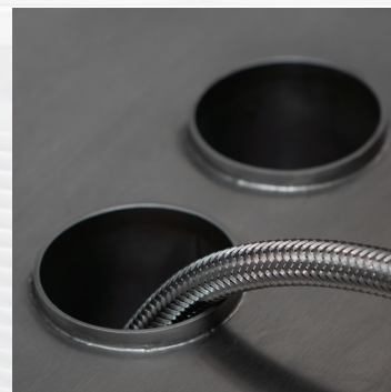
Durchführung für Versorgungsleitungen Cut out for supply pipes