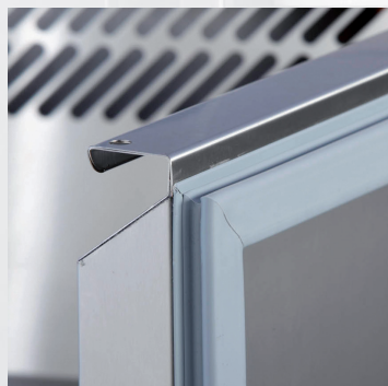
Faltenfreie Magnetchichtung – hygienisch einwandfrei Magnetic gasket with even surface for perfect hygienic conditions