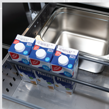
Trennstäbe zur Schubladenunterteilung Separation bars for drawer