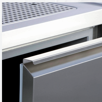
Mit Griffleiste With integrated handle strips

The perfect coffee-station, engineered down to the last detail, completely equipped and ready for immediate use. Milk can be cooled in the drawers. Cut outs allow for a direct connection with your fully automatic coffee machine. The shelves are adjustable in height and can be adapted to your individual needs. The optional cup dispensers are mounted in a stainless steel panel.