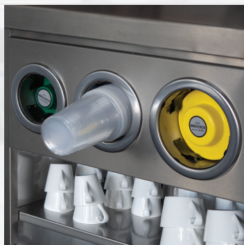
Optional Becherspender Optional cup dispenser